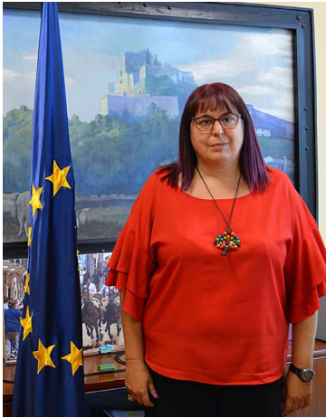
Begoña García Bernal Consejera de Agricultura, Desarrollo Rural, Población y Territorio de la Junta de Extremadura

Las cooperativas representan un sector de actividad económica de especial interés para el mercado y tejido empresarial de Extremadura, contribuyendo a la vertebración del territorio, al dar continuidad a la actividad agraria, fomentando el empleo rural y teniendo una especial capacidad para ser motor de desarrollo económico y social, favoreciendo, por tanto, la viabilidad y sostenibilidad de nuestras zonas rurales y la fijación de la población al territorio, sobre todo mujeres y jóvenes.